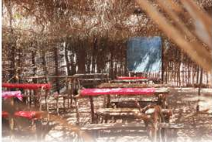
« Di tabanka pa skola » de la maison à l'école ... solidaire